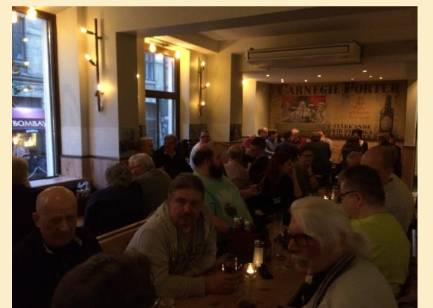
Middag efter kongressen.