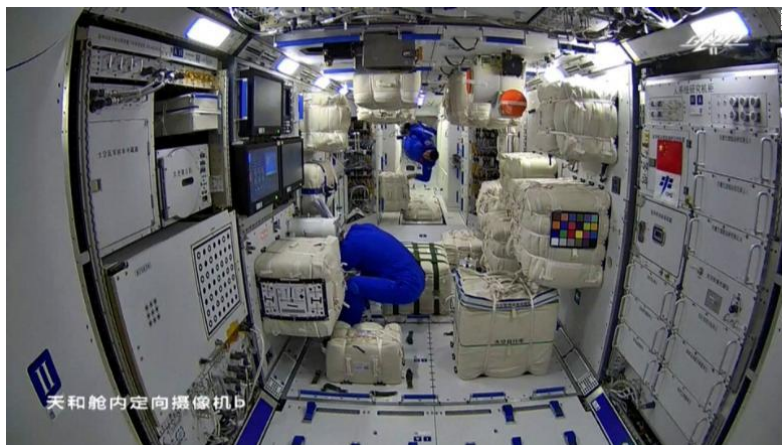
Rymdstationen Tiangong som är under uppbyggnad. CNN.

https://en.wikipedia.org/wiki/File:Tianwen-1_launch_04_(cropped).jpg