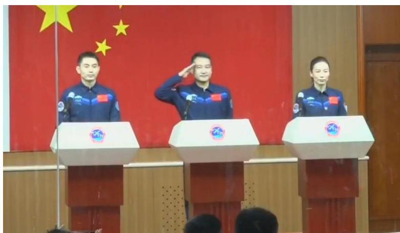
De tre taikonauterna som nu befinner sig på rymdstationen Tiangong.

https://commons.wikimedia.org/wiki/File:Shenzhou_13_crew.jpg