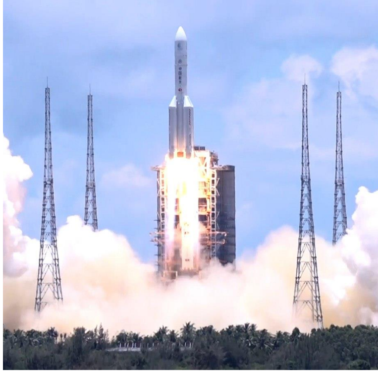
Uppskjutningen av marsrovern Tianwen.

https://edition.cnn.com/2021/06/21/china/china-us-space-race-mic-intl-hnk/index.html