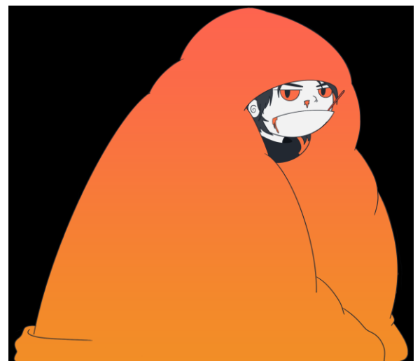
Kongressens logga gjord av Anna Kashubina.

För mer information se kongressens hemsida: https://hostcon.clubcosmos.net